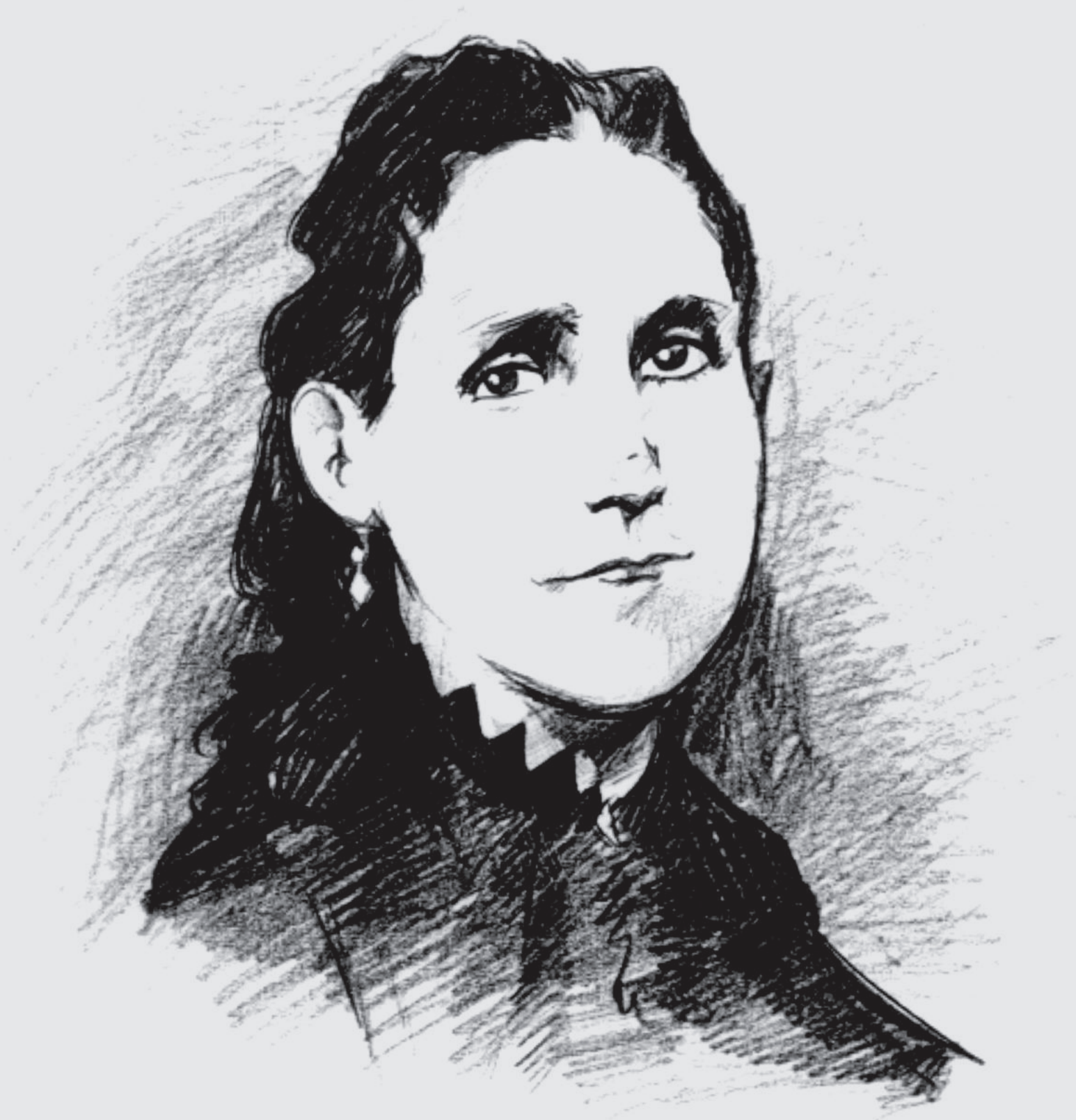
Rosa Protomártir Duarte y Díez