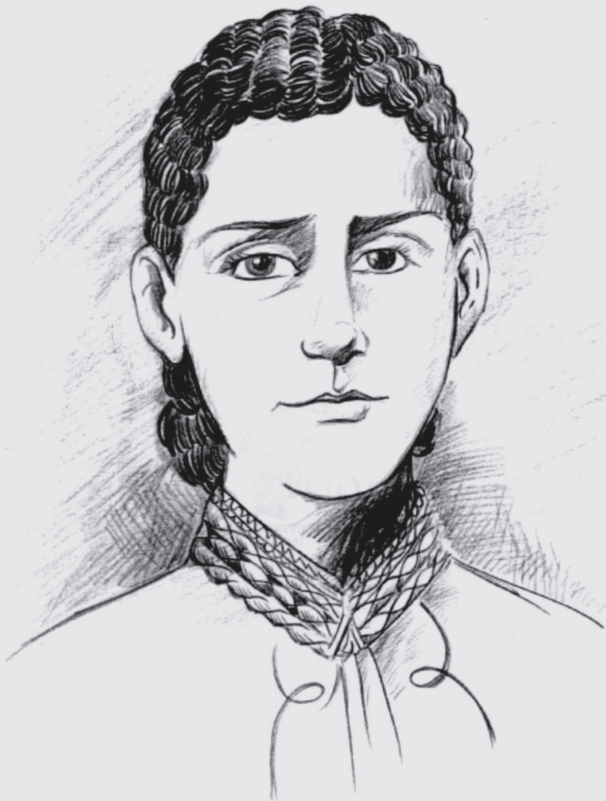
María Trinidad Sánchez